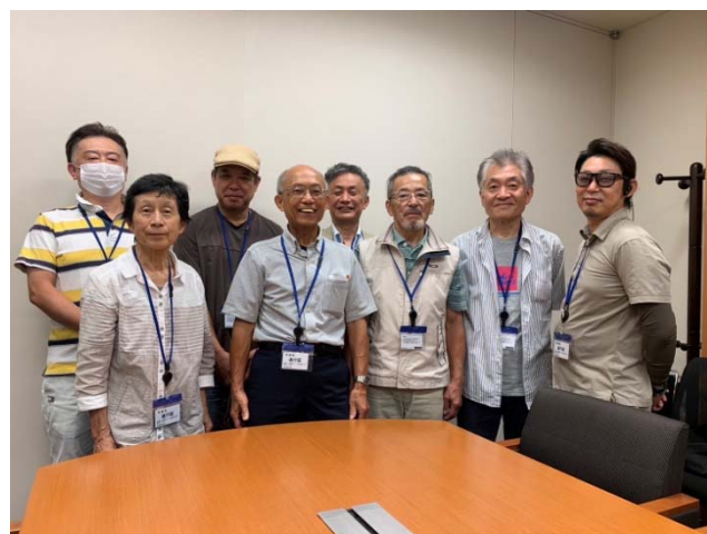
(愛商連の代表団。右から3人目が朝長さん。)

自民党の裏金問題に国民の多くが怒りを爆発させる中、私たち中小業者にとってインボイス制度廃止、消費税減税等は切実な問題です。