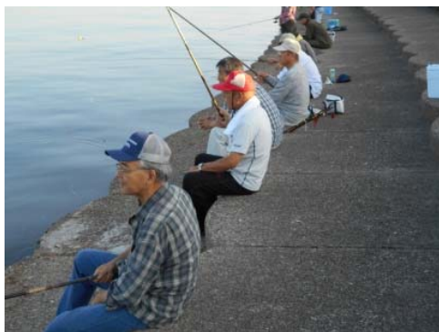
(一列に並んで竿を下ろします)